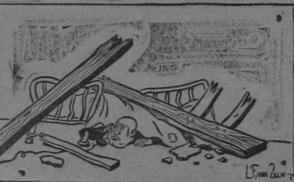
Hitler: —Yo me paso las noches sin poder dormir... Musso: —¿Sin poder dormir? Y qué te crees tú que yo hago...?