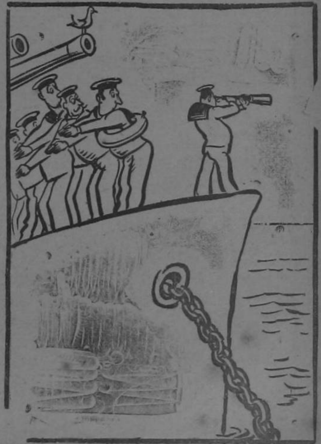
La flota italiana se prepara para entrar en acción

—¡Bueno es culantro pero no tanto y no es gracia eso de quedarse sin Inés y sin el retrato!