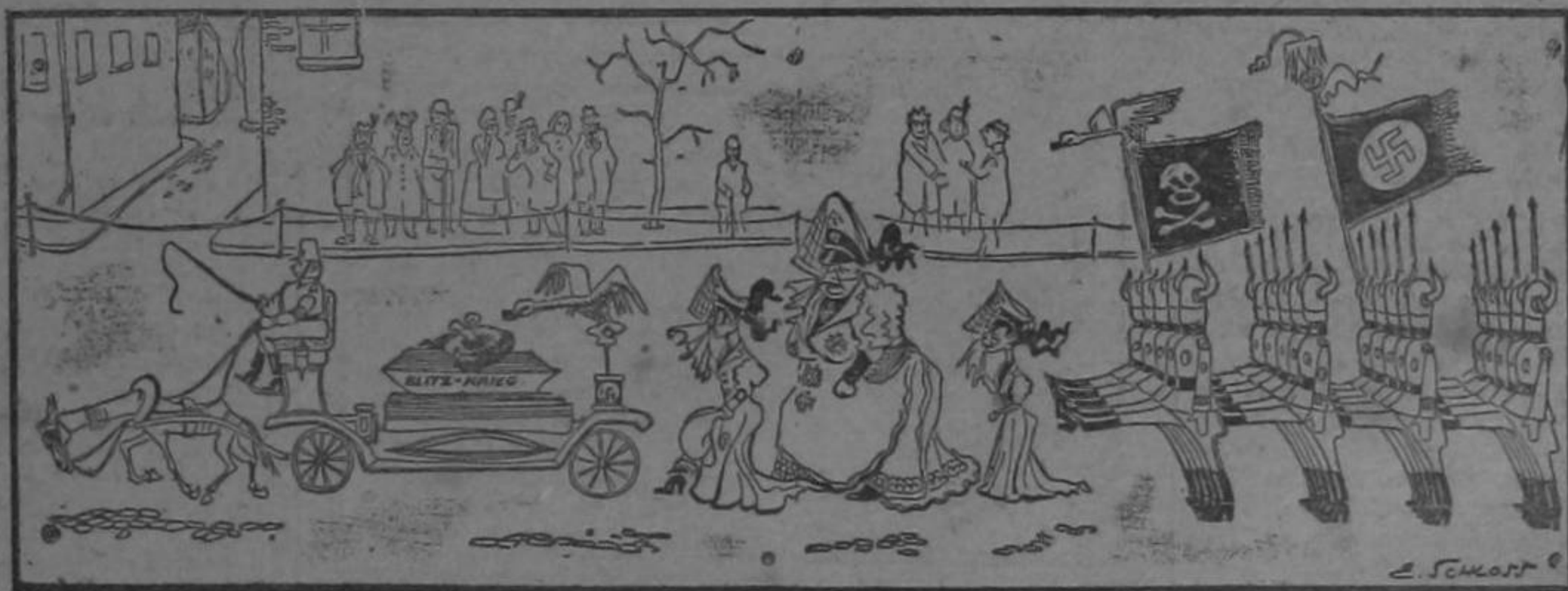
La muerte de la guerra relámpago